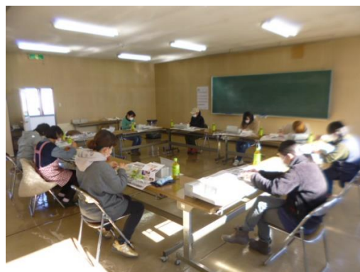
-ソーシャルディスタンスを保って-