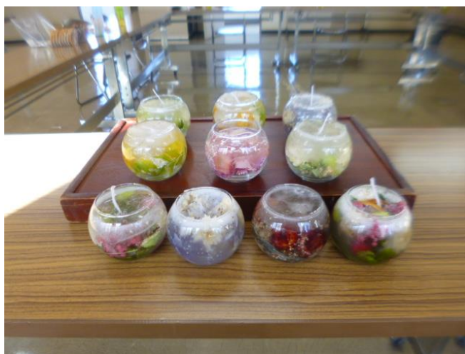
-綺麗に出来ました-

令和2年12月17日、南酪クローバー会はジェルキャンドル講習会を開催しました。新型コロナウイルス禍での開催の為、感染リスクを減らす様対策を取りつつ会員のみで出来る内容にしました。多少でこずった所もありましたが、みんなで協力し合いなんとか作品を仕上げました。