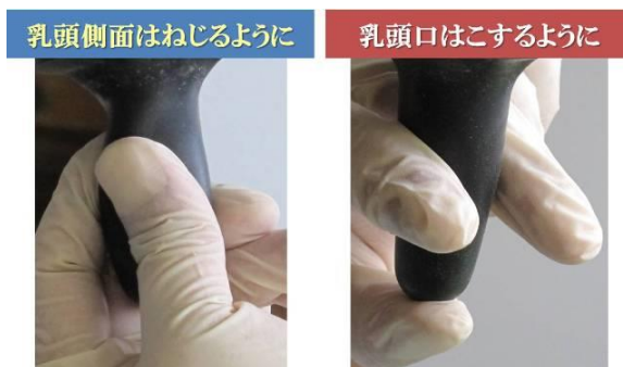
写真2 乳頭清拭は2工程

乳頭清拭作業は2工程あります。一つは乳頭側面、もう一つは乳頭口の清拭です。乳頭側面はねじるように拭きます。乳頭口はこするように拭きます(写真2)。とくに乳頭口をより丁寧に拭くことは、乳牛にとってより強烈な搾乳刺激になります。